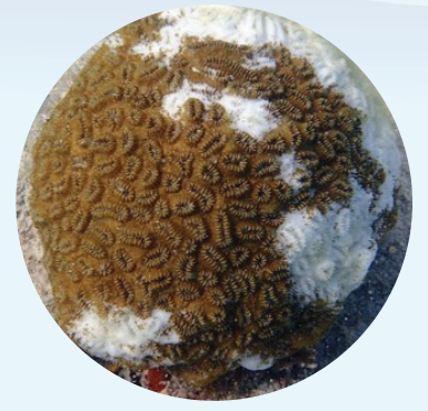
Corail dur malade