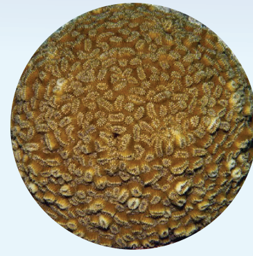
Corail dur sain